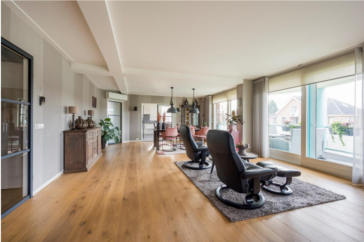
Twee schuifpuien naar het balkon